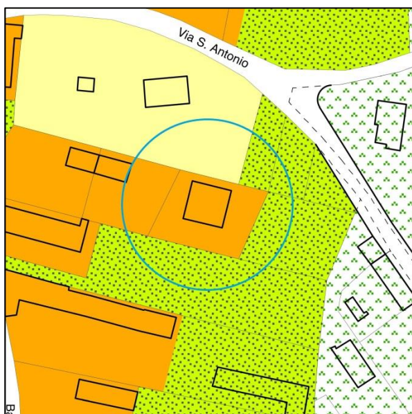
Stato di fatto